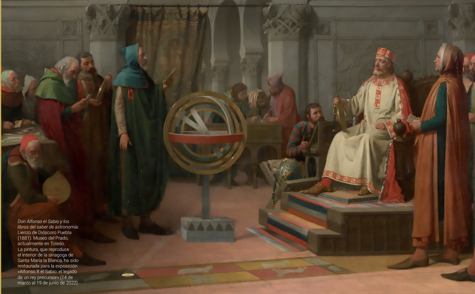
Don Alfonso el Sabio y los libros del saber de astronomía. Lienzo de Dióscoro Puebla (1881). Museo del Prado, actualmente en Toledo. La pintura, que reproduce el interior de la sinagoga de Santa María la Blanca, ha sido restaurada para la exposición «Alfonso X el Sabio: el legado de un rey precursor» (14 de marzo al 19 de junio de 2022).

La celebración del VIII Centenario del nacimiento de Alfonso X es una oportunidad ineludible para profundizar en la figura del rey Sabio. Ese es el objetivo de los ciclos de conferencias celebrados en Toledo, lugar de nacimiento del monarca, durante los años 2021 y 2022. En ellas se reúnen las últimas investigaciones sobre esta figura trascendental para la lengua, la política y la cultura de la España medieval. Este es el segundo de estos ciclos: «Alfonso X: el legado de un rey precursor (II)», organizado por el Ayuntamiento de Toledo en colaboración con el Museo del Ejército y el Museo de Santa Cruz de Toledo.